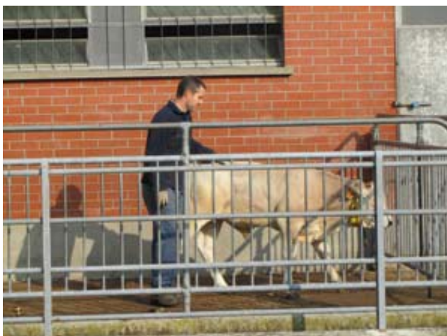
Terza fase del test: vitello docile che accetta il contatto

L'Anaborapi da alcuni anni si occupa di raccogliere informazioni relative al temperamento degli animali. Per ragioni pratiche i rilievi sono effettuati sui vitelli durante la loro permanenza nel Centro Genetico. Dal dicembre 2006 viene effettuata una valutazione del temperamento a fine prova, quando i vitelli hanno un'età di circa 12 mesi. Il rilievo avviene durante le operazioni di misurazione dei vitelli, e consiste nell'attribuzione ad ogni soggetto di un punteggio variabile da 1 a 4 a seconda delle difficoltà incontrate nel manipolare e condurre l'animale. Codici bassi vengono assegnati ad animali tendenzialmente docili, mentre codici alti indicano vitelli aggressivi. Questo test, sebbene stia producendo dei dati interessanti, mostra dei limiti: in base a quanto visto prima i vitelli hanno già un'età relativamente elevata ed i punteggi sono assegnati con una metodica piuttosto generica. Per migliorare la qualità dei dati, a partire dal mese di Aprile di quest'anno si è adottato un nuovo test, completamente dedicato al temperamento e più