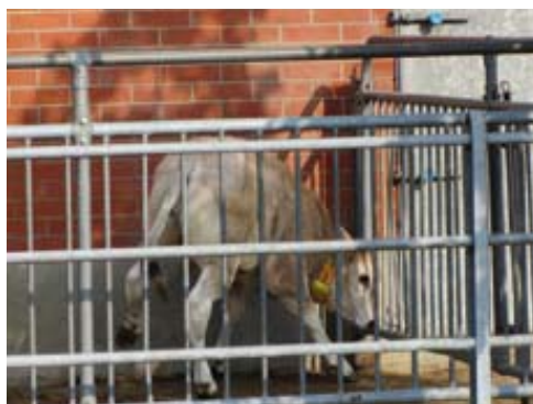
Seconda fase del test: vitello spaventato in cerca di una via di fuga

minato una forte riduzione delle interazioni tra l'allevatore e gli animali, limitando il contatto diretto a pochi momenti (parto, inseminazione, trattamenti sanitari, eventuali spostamenti) durante la vita dell'animale. Inoltre, l'allevamento dei vitelli sotto le madri ha favorito l'insorgenza di istinti di protezione da parte delle vacche che, se da un lato sono molto naturali dal punto vista biologico, dall'altro possono talvolta determinare reazioni aggressive nei confronti delle persone che entrano nel "territorio" delle bovine.