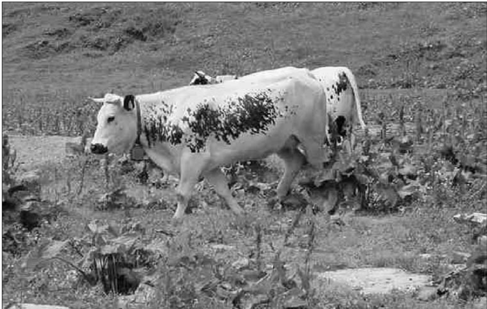
Figura 2 –Soggetto di razza Barà al pascolo

Per l'analisi sono stati impiegati 59 campioni Barà, 27 Pustertaler, 50 Frisona e 50 Piemontese. Sono state calcolate le distanze genetiche tra i 4 gruppi con il programma MICROSAT, in base alla proporzione di alleli condivisi. La matrice delle distanze è stata usata per costruire il diagramma N-J con il metodo Neighbour-Joining.