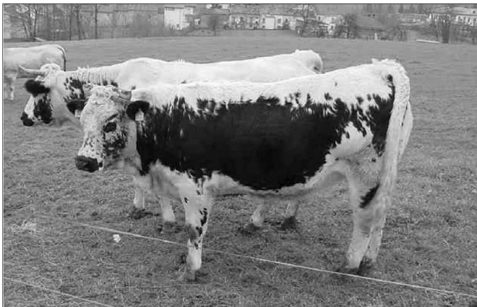
Figura 1 – Bovini di razza Barà

Per quanto riguarda l'origine della popolazione Barà attualmente rinvenibile in Piemonte sono state formulate diverse ipotesi: la prima farebbe risalire la provenienza di questi capi a diversi secoli fa, a seguito delle migrazioni delle popolazioni Walser. Un'altra è legata alla testimonianza di alcuni allevatori che ricondurrebbero la presenza di questi soggetti ai primi del '900, quale conseguenza dei numerosi flussi di immigrazione coinvolgenti anche gruppi